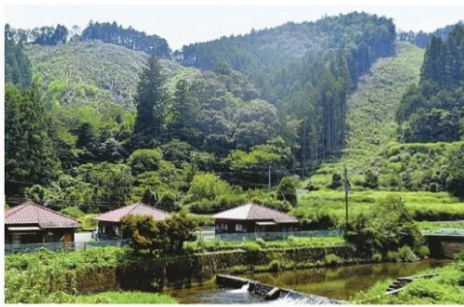
皆伐された後、数年間造林されない山。伐採跡地は草程度しか生えていない(徳島県那賀町)8月

徳島県南部、那賀川の流域に広がる那賀町は面積の95%を森林が覆う。2017年度末時点のデータを毎日新聞が集計した結果、県内の造林未済地の半分にわたる176ヶ所が町内に集中している。町中心部から車で約20分の白ヶ谷地区で8月、全面伐採(皆伐)された民有林を県や町の担当者とともに訪れた。「あの部分が造林未済地です」。町道の脇から町職員が指した1000坪ほどの民有林のうち、植栽を計画していない▽自然による再生を期待しながら、伐採後5年以内で木が生えていない▽違法に伐採され、再生していない▽のいずれかと定義。民有林でも天然林の伐採跡地は計の対象外。政府が管理する国林では「未済地はない」との立場を取っている。